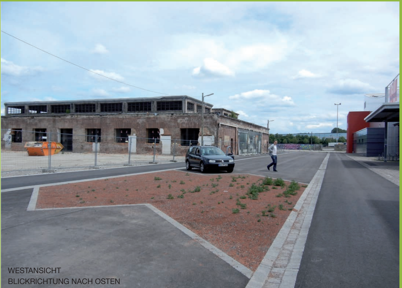
WESTANSICHT BLICKRICHTUNG NACH OSTEN