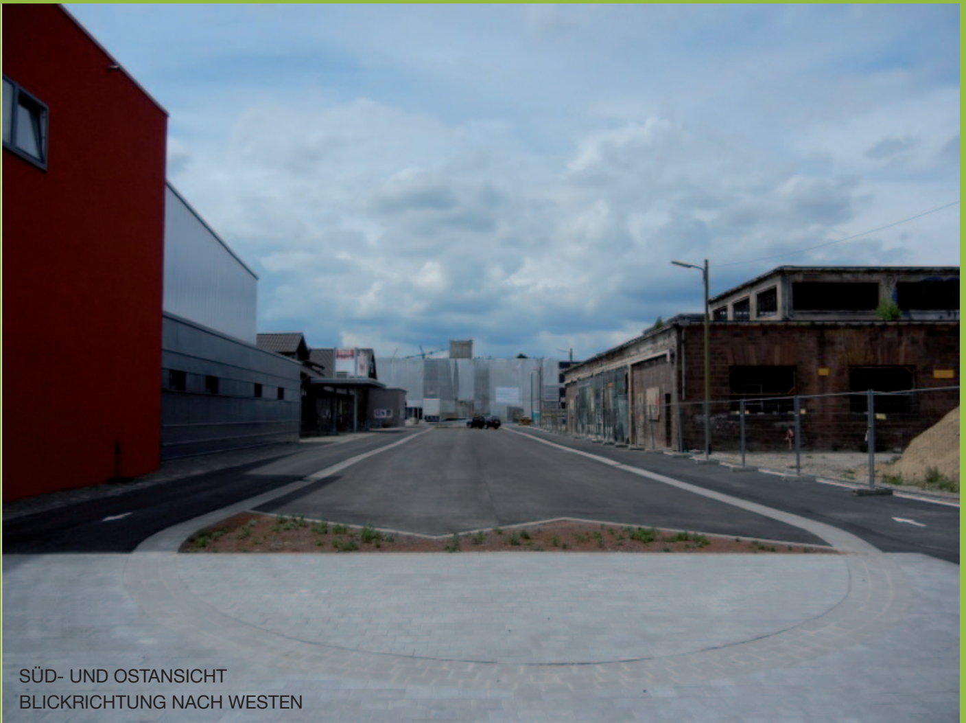
SÜD- UND OSTANSICHT BLICKRICHTUNG NACH WESTEN