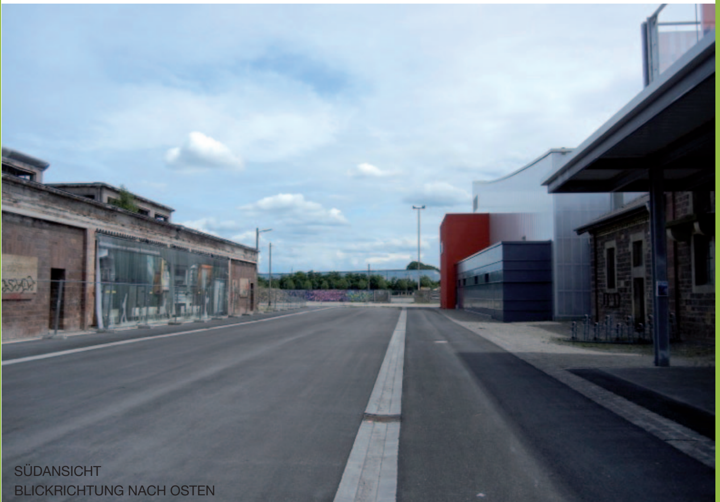
SÜDANSICHT BLICKRICHTUNG NACH OSTEN