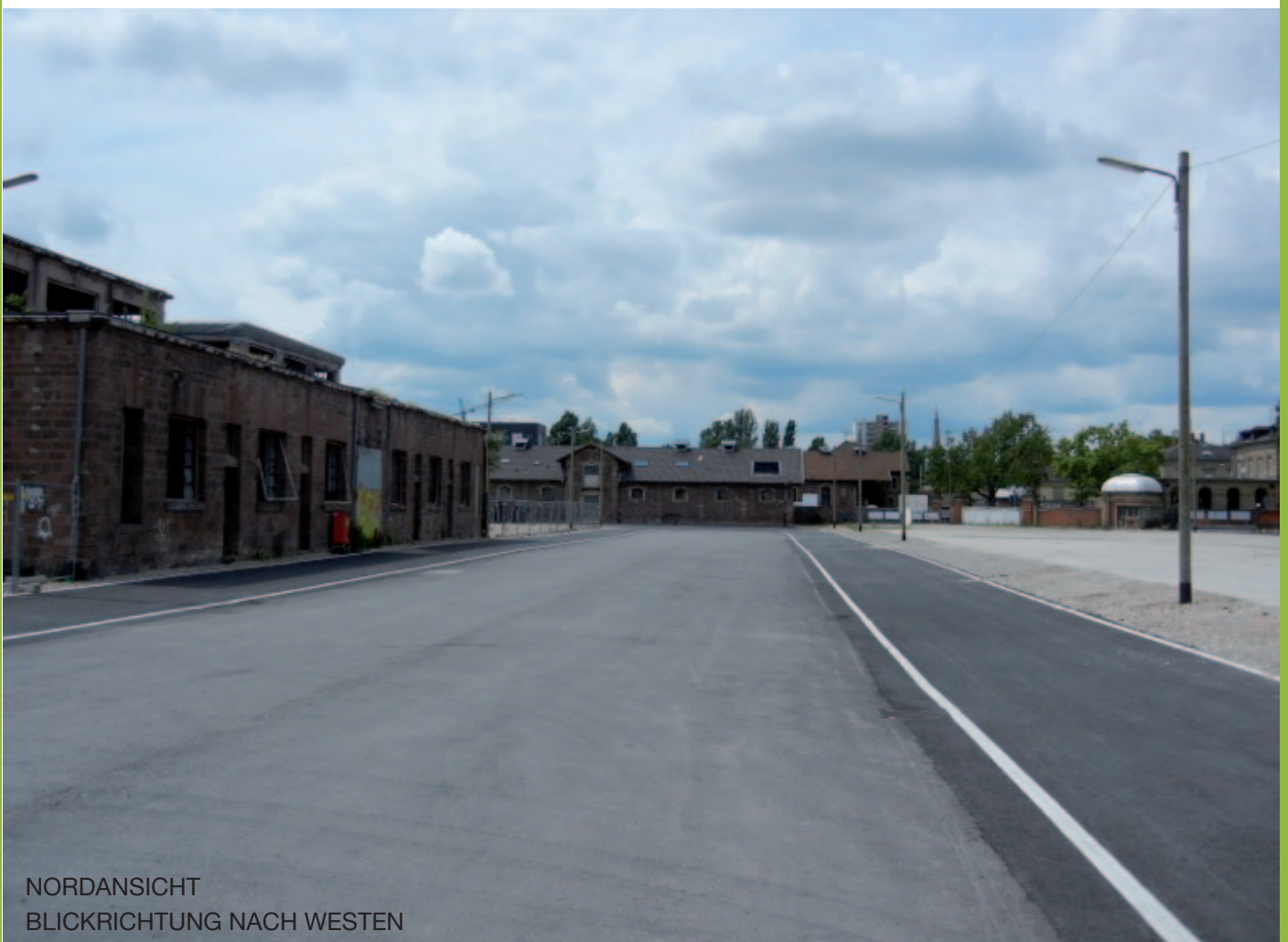
NORDANSICHT BLICKRICHTUNG NACH WESTEN